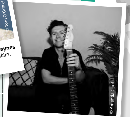
MT Jones kombiniert Soul, modernen R&B und Jazz zu einem gleichwohl zeitgemäßen wie zeitlosen Sound.