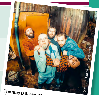
Thomas D & The KBKS interpretieren die Songs und Texte des Rappers der Fantastischen Vier mit instrumentalem Tiefgang neu.