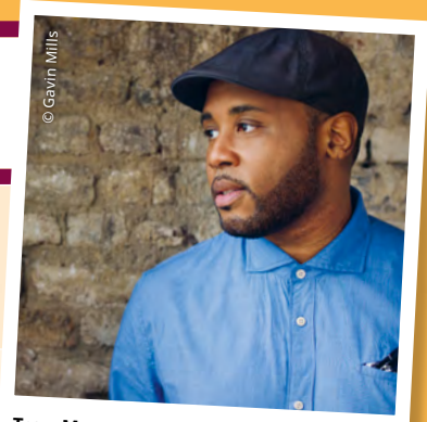
Tony Momrelle ist einer der aufregendsten und bedeutendsten Soulmusiker auf der modernen britischen Bühne.